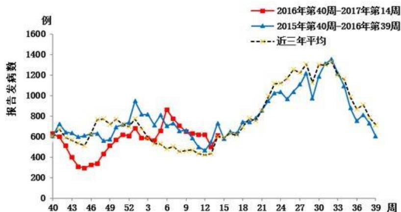
图1 其它感染性腹泻病周报告病例情况