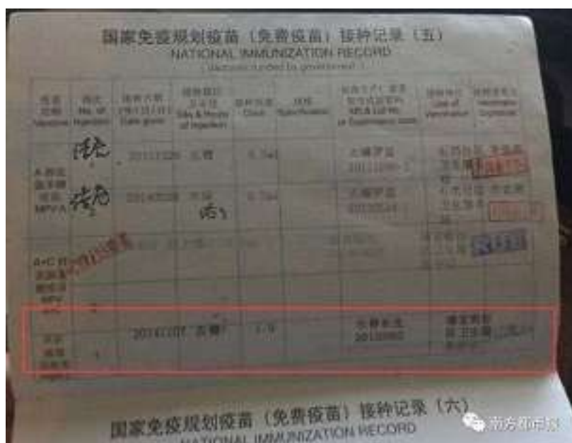
(図) ワクチン接種記録 (南方都市报)

彼らは子供たちに接種されたワクチンの多さに気づき、 DPT 混合ワクチン や A 型肝炎ワクチン 、水痘ワクチンなどを含めて、そのメーカーが長生物であることを見つけ、また、一種類だけではなく長生物が全種類に亘り生産していることを知ったのだ。