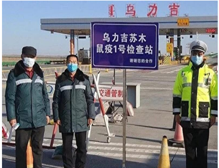
11 月 21 日、内モンゴルアラシャー盟現地にペスト検査所を設置（アラシャー警察発表）

政府側はそのホームページ上で再三にわたり、「平安」と報道しているが、内モンゴルの予防管理は日増しに状況が悪化している。内モンゴルシリングゴル盟は、ヘリを出動させて鼠を減らすことで「ペスト」拡散を防いでいる。