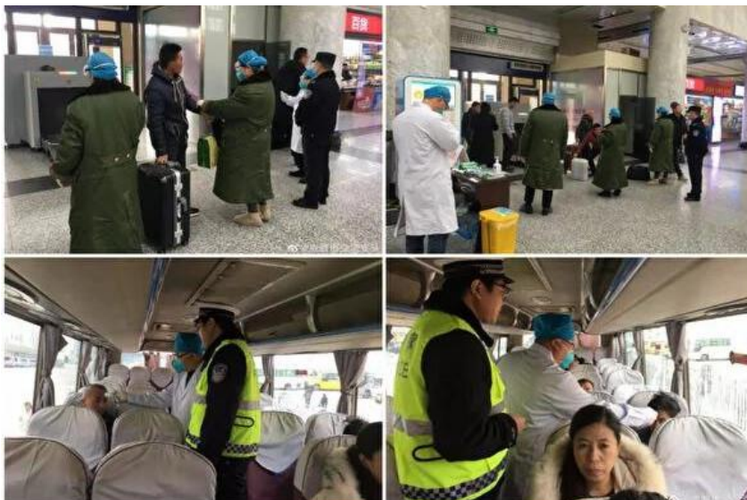
図 2：11 月 21 日、赤峰市交通警察が病院で検温実施（赤峰警察）