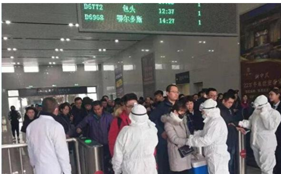
図 3：内モンゴルのオールドス駅では、乗客が逐一体温検査を受けている

現在、内蒙古の多くのバス停や駅、空港、病院などでは体温測定がなされている。あるモンゴル人の友達は微博の上に以下のメッセージを残している：「ペストはほんまに酷い状況やで。病院の入り口を通る人はみいんな体温を測られてるんや！」