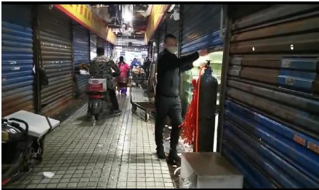
店内の物資をもって店を離れる店主も

新京報は、先の報道で、「12月31日、武漢市衛生健康委が発表した通報では最近一部の医療機構で診察した肺炎患者の多くが華南海鮮城と関連があり、これまでに患者27名が見つかりうち7名が危篤でその他の患者は安定しており制御可能、2名の患者は病状が好転して近々退院する。患者の臨床症状は主に発熱であるが、少数患者には呼吸困難がみられる。現時点では既に患者たちは全て隔離治療を受けている。初歩段階の分析によると上述患者はウィルス性肺炎に属し、これまでにヒトヒト感染の明らかな現象は見られておらず、病原の検査及び感染原因の調査が進行中である」と報じた。