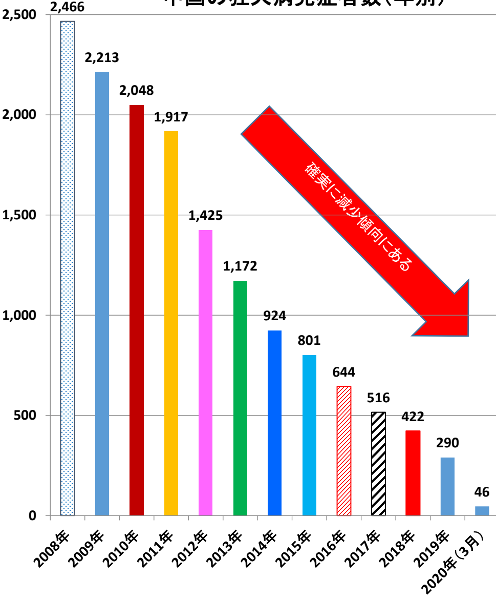
中国の狂犬病発症者数(年別)