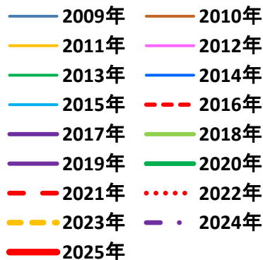
中国の手足口病死亡者数(月別)